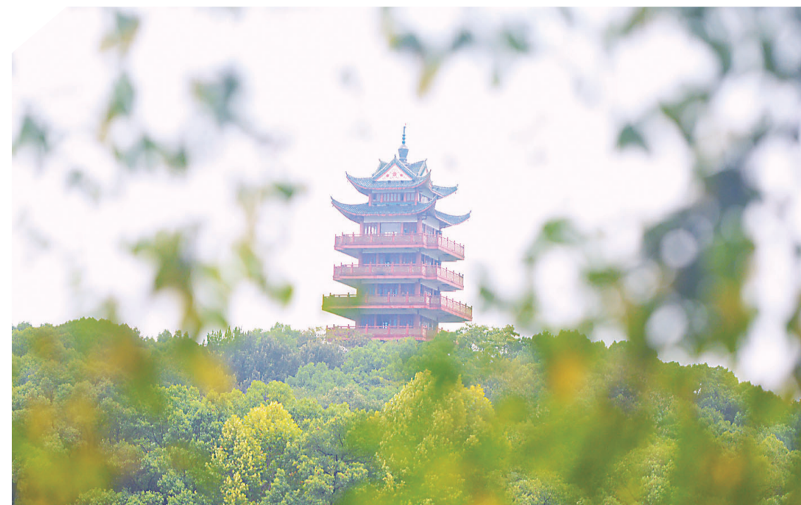
▲昨日,神农公园,一片片浅黄色的叶子洋溢着浓浓秋意