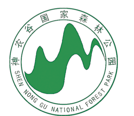
▲神农谷,炎帝陵,年平均气温12.3℃,既是人文圣地,也是养生天堂!

开奖 (开奖日期:2017年10月18日) 大乐透 第2017122期 中奖号码:03 12 18 29 34 特殊号码:03 11 3D 第2017284期 中奖号码:1 3 1 体彩 排列三 第2017284期 中奖号码:6 1 8 排列五 第2017284期 中奖号码:6 1 8 5 9 七乐彩 第2017122期 中奖号码:01 04 08 09 11 12 21 特殊号码:02