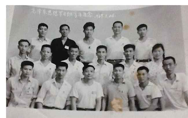
图片摄于1967年。当年,军宣队进驻湘江机器厂(现在的南方公司),我(第二排左一)同五分厂部分干部和工人参加学习毛主席关于三线建设等一系列重要指示。不久,我和其中的6位战友奔赴湘西沅陵建设三线工厂(五三机械厂),一去就是20年。现在我们已是八旬老人。