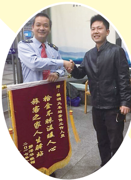
▲失主小郭给株洲车站送来锦旗

取得联系，“没想到钱包能失而复得，真是太谢谢你们了。”原来，当日小郭在株洲车站乘坐K810次前往常德返校读书，由于到达车站时间比较晚，乘车时匆忙，不慎将钱包遗失在楼道上。