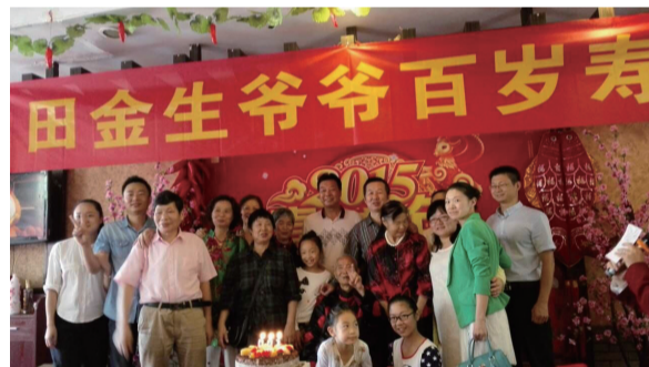
▲田老一家人的合照