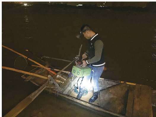
▲查获电打鱼船

“这个用加压器的电线电打鱼设备,功率很大,对湘江渔业资源的危害十分大。”刘站长说,船主估计是刚刚准备出船,还没有收获,所以他们只能收缴电打鱼设备。