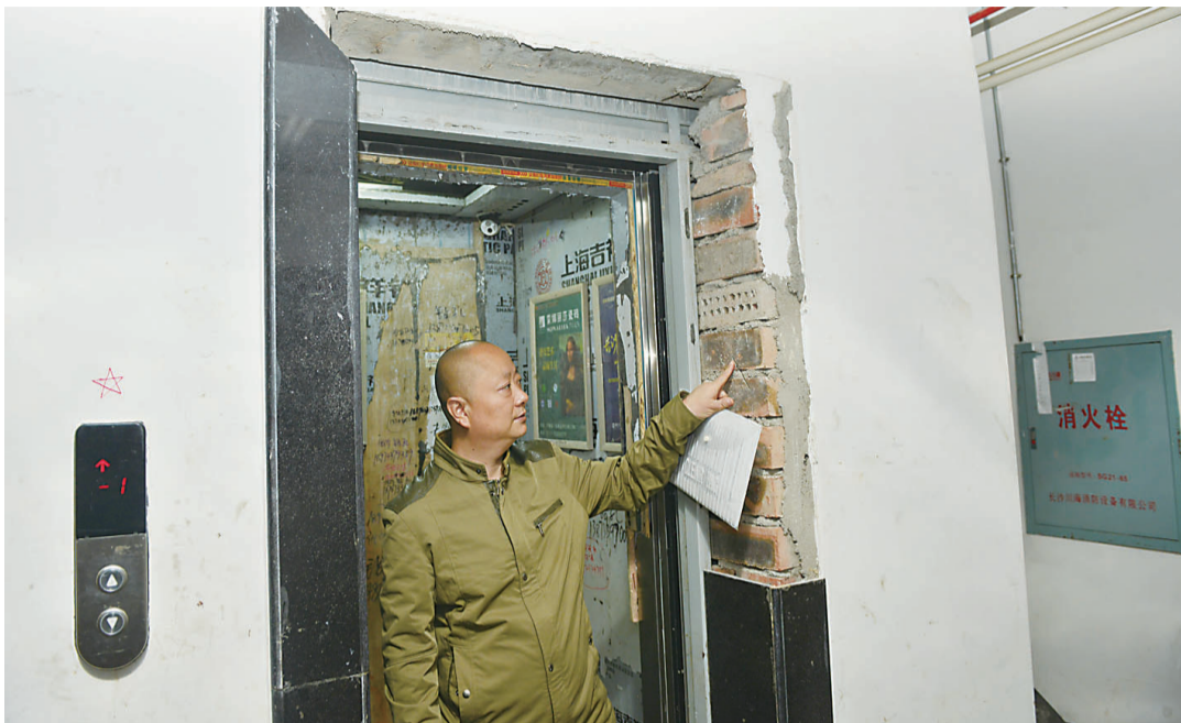
▲10月13日,莱茵小镇小区21栋负一楼,电梯口门框砖头裸露

昨日,石峰区莱茵小镇一业主拨打晚报新闻热线28829110反映:莱茵小镇电梯存在卡人、掉层、电梯噪音等故障。