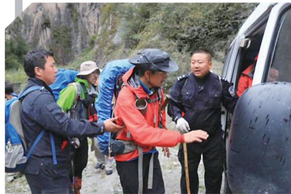
▲救援队营救被困驴友

10月12日,记者从四川卧龙国家级自然保护区管理局和卧龙特别行政区森林公安局了解到,3名违规进入卧龙保护区的驴友每人被罚款5千元,同时承担此次救援行动所产生的费用42506.10元。