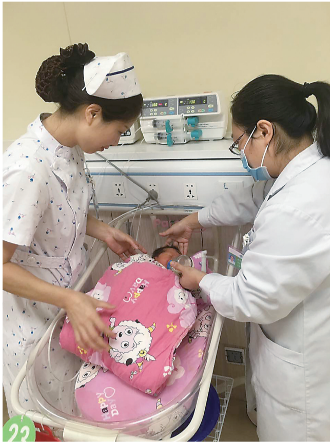
▲医护人员在照顾弃婴

昨日，有市民拨打晚报新闻热线 28829110 反映：8日，职教城某商场的厕所垃圾桶里发现一名刚出生不久的弃婴，当时孩子情况很不好，最终在爱心人士、派出所民警的帮助下送到了医院。