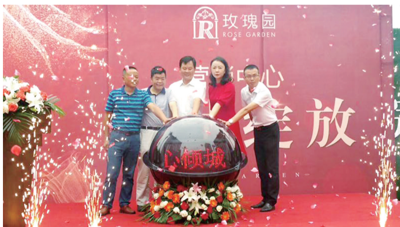
▲营销中心开放现场

日前,黄河北路又一新楼盘面世。10月2日,由玫瑰园房地产开发有限公司建设的高端洋房住区玫瑰园项目营销中心倾城绽放,诸多人士共同见证了玫瑰园这一株洲未来理想生活住区盛大开放的历史时刻。