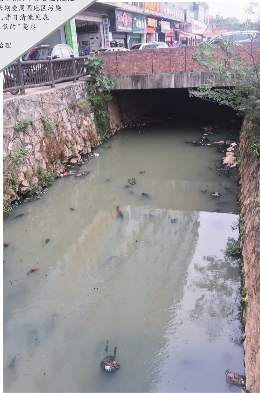
▲如今,建宁港水质是黑色的,还发出臭味

建宁港全长12.2公里,流域面积36.9平方公里,流经荷塘区、芦淞区繁华闹市。由于长期受周围地区污染企业废水、生活污水直排等影响,昔日清澈见底的建宁港却变成了一条人见人恨的“臭水沟”,周边数万居民深受困扰。值得欣慰的是,目前建宁港治理相关工作已经启动,预计到2019年底,工程将完工。届时,建宁港将恢复往日水质清澈,鱼虾满港的美景。