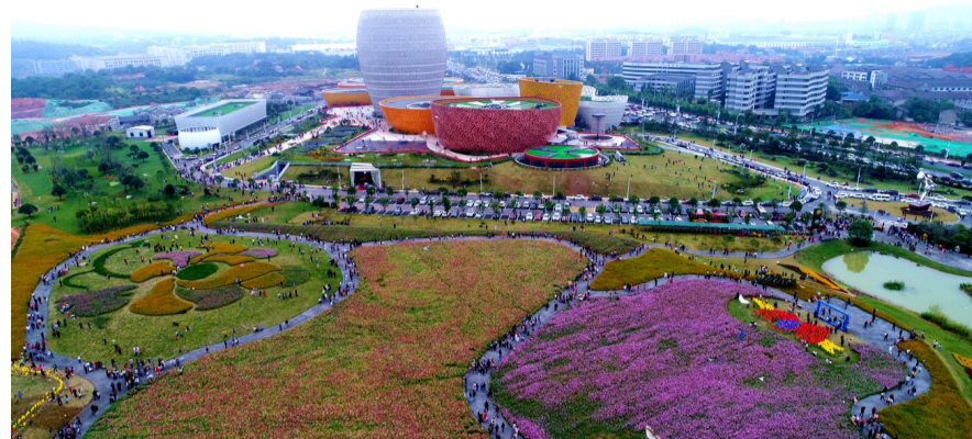
▲醴陵瓷谷盛开的鲜花,吸引了不少市民前去观赏

记者昨从市旅游外事侨务局获悉,今年国庆黄金周,我市旅游总人数达394.07万人次,旅游总收入20.99亿元,与去年相比分别增长20.49%和23.94%。