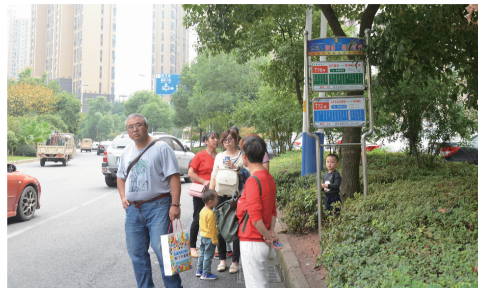
▲公交站台设在绿化带上，市民站在马路边等车

近日，有市民拨打晚报新闻热线28829110反映：位于株百栗雨店旁边的高科·慧谷阳光公交车站设置不合理，一块站牌立在绿化带里，乘客只能站在马路边等车，很不安全。