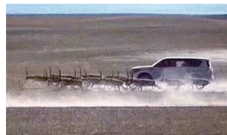
▲越野车追赶藏羚羊现场视频截图

10月8日晚，西藏自治区林业厅通过官方网站公布“越野车追赶藏羚羊”一事处理结果，7名涉事人员各自被罚15000元，共计105000元。