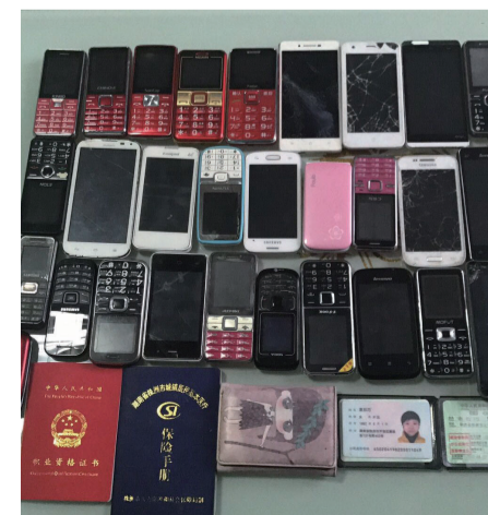
▲部分未领走的物品(包含节前捡到的物品)

工作人员提醒乘客，随身物品最好直接背着或挂在身上，下车时记得摸摸口袋，以防止小件物品滑落。