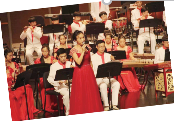
▲观众表示:“本场音乐会高品位,有特色!”

景炎学校创新打造的体育文化课程,既锻炼了学生意志,充分展示了学生的能力,又让学生获取了知识,提升了素养,获得了社会各界一致好评。