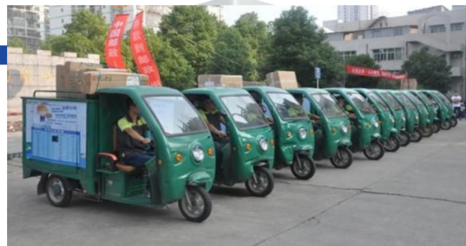
▲株洲邮政投递车队整装待发

力推进“普惠金融、农村电商、快递改革”,促进邮政服务业转型升级,带动邮政金融扶贫、电商扶贫、快递扶贫和信息、科技、文化、健康扶贫,成为政府实施精准扶贫、改善民生服务的重要渠道,实现企业效益和社会效益“双丰收”。