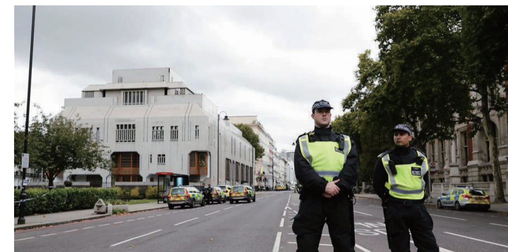
▲案发现场附近,警察封锁通往现场的道路

当地时间10月7日下午14时20分,在英国首都伦敦的自然博物馆附近发生了一起汽车撞人事件,据警方介绍在事件中有多名行人受伤,但伤势并不严重。