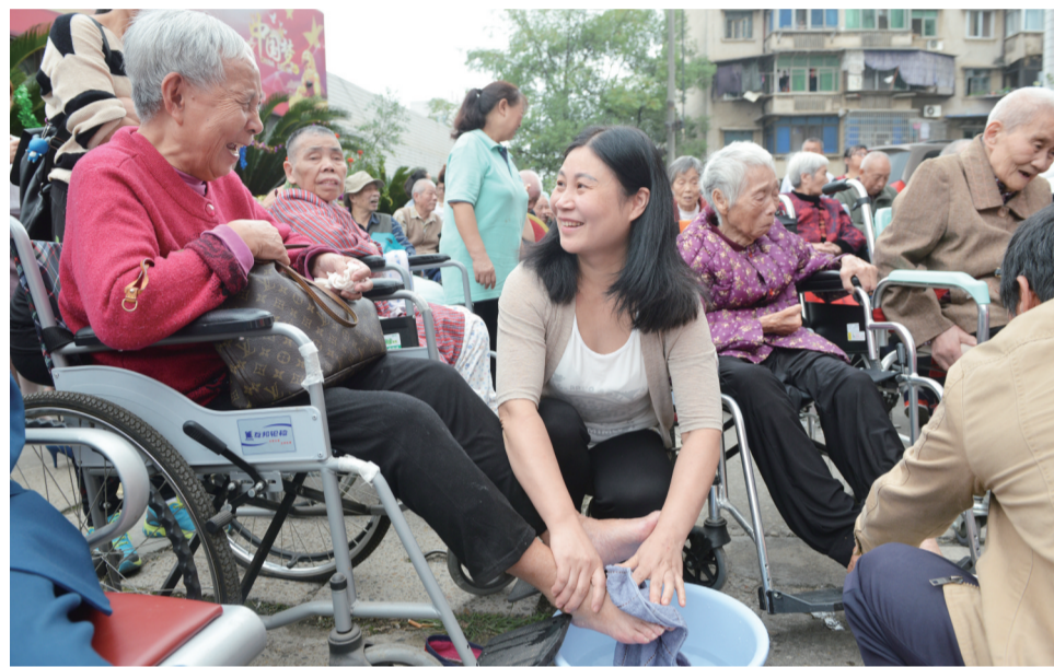
▲10月8日,株洲海福祥养老院,儿女们为父母洗脚

本报讯(记者 姚时美)你有没有为父母洗一次脚?昨日是国庆长假最后一天,株洲海福祥养老护理院组织了一场敬老爱老活动,其中最吸引人的,莫过于60名子女端着水盆,集体为各自的父母洗一次脚,现场有子女不禁热泪盈眶。