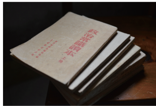
▲老人收藏的五十年代的老课本