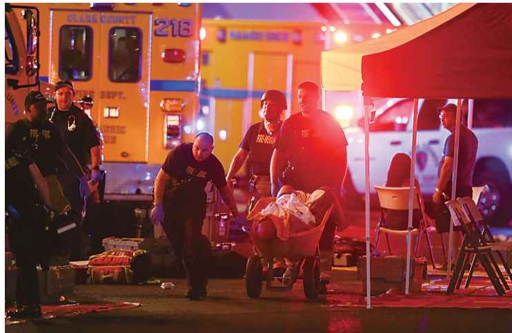
▲工作人员在枪击事件现场救治伤者