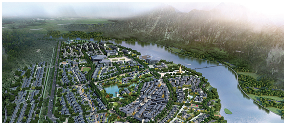
▲南部片区未来农庄群效果图

本报讯(记者 旷昆红 通讯员 戴伟)9月27日,株洲高新区(天元区)投融资促进会举行株洲农村商业银行涉农融资产品推介会。记者从会上获悉,天元区南部片区现代农业产业园概念性规划出炉,将投资30亿元建成年产值不低于50亿元的现代农业产业园区。