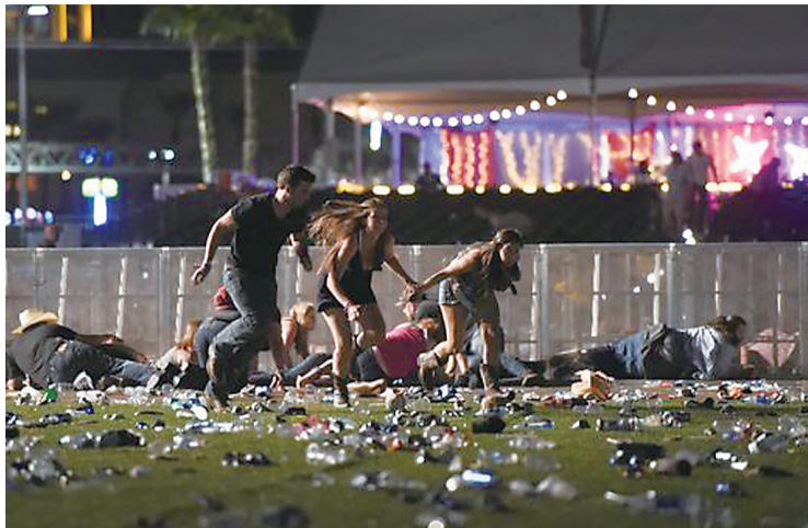
▲现场民众四散奔逃