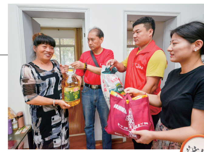
▲义工将爱心物资送到贫困户家中