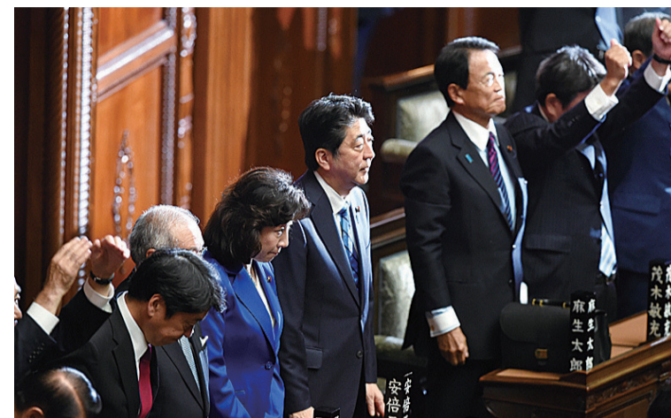
▲9月28日,安倍晋三(左四)在聆听众议院议长大岛理森(未在画面中)宣读解散众议院诏书

日本首相安倍晋三28日召集举行第194届临时国会的众议院全体会议,宣布正式解散国会众议院。安倍此次在临时国会强行解散众议院遭到日本各界反对。当天中午,民众在日本国会前举行集会,反对安倍在这一时期解散众议院。