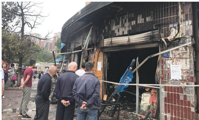
▲火灾现场

拒绝签字,医院出于人道主义,在紧急情况下为患者实施手术,属于合情、合理、合法。”聂炜说,虽然相关法律对医生有所保护,但目前对于医生因此承担的风险并没有明确的保障性说法,患者家属一旦认为手术失败或者没有达到预期效果,医院可能会惹来官司,而这种情况在国内也时有发生。