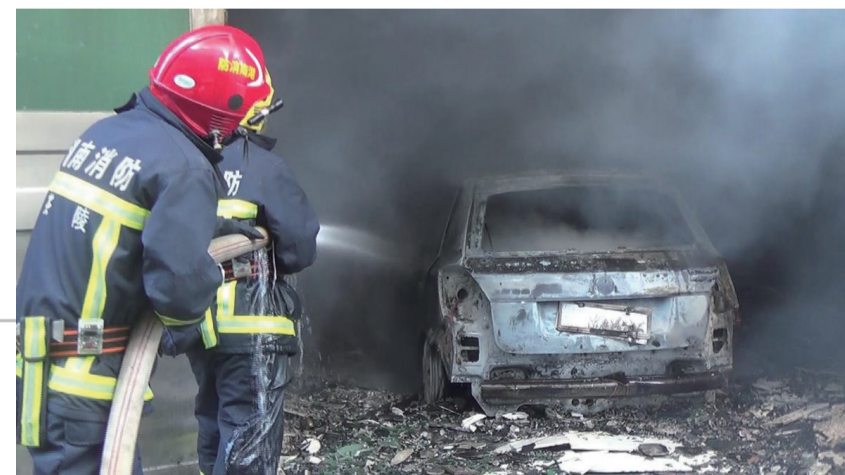
▲消防员正在灭火,小车被烧毁