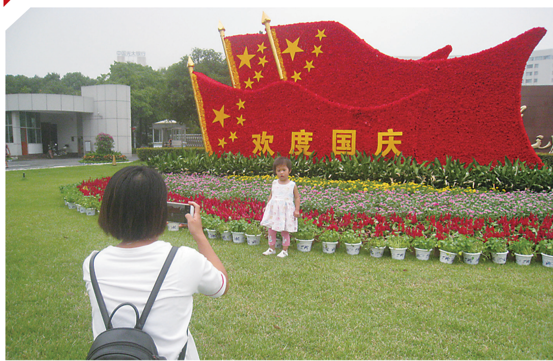
▲临近国庆,市苗圃提前布置大气靓丽的花卉造型,其中市委西侧草坪的红旗造型高3.5米,宽9米,吸引市民驻足欣赏