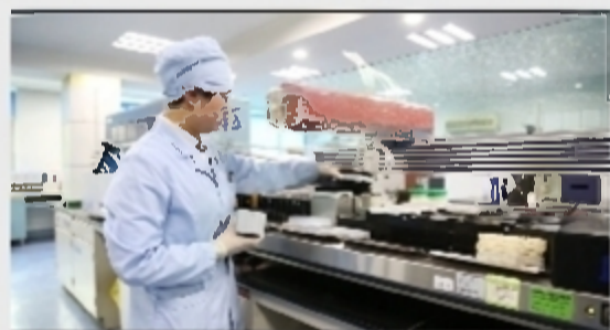
株洲市中心血站检测科免疫实验室2