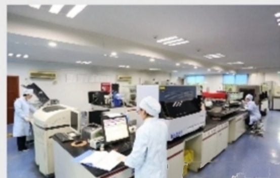
株洲市中心血站检测科免疫实验室