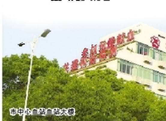
市中心血站血站大楼