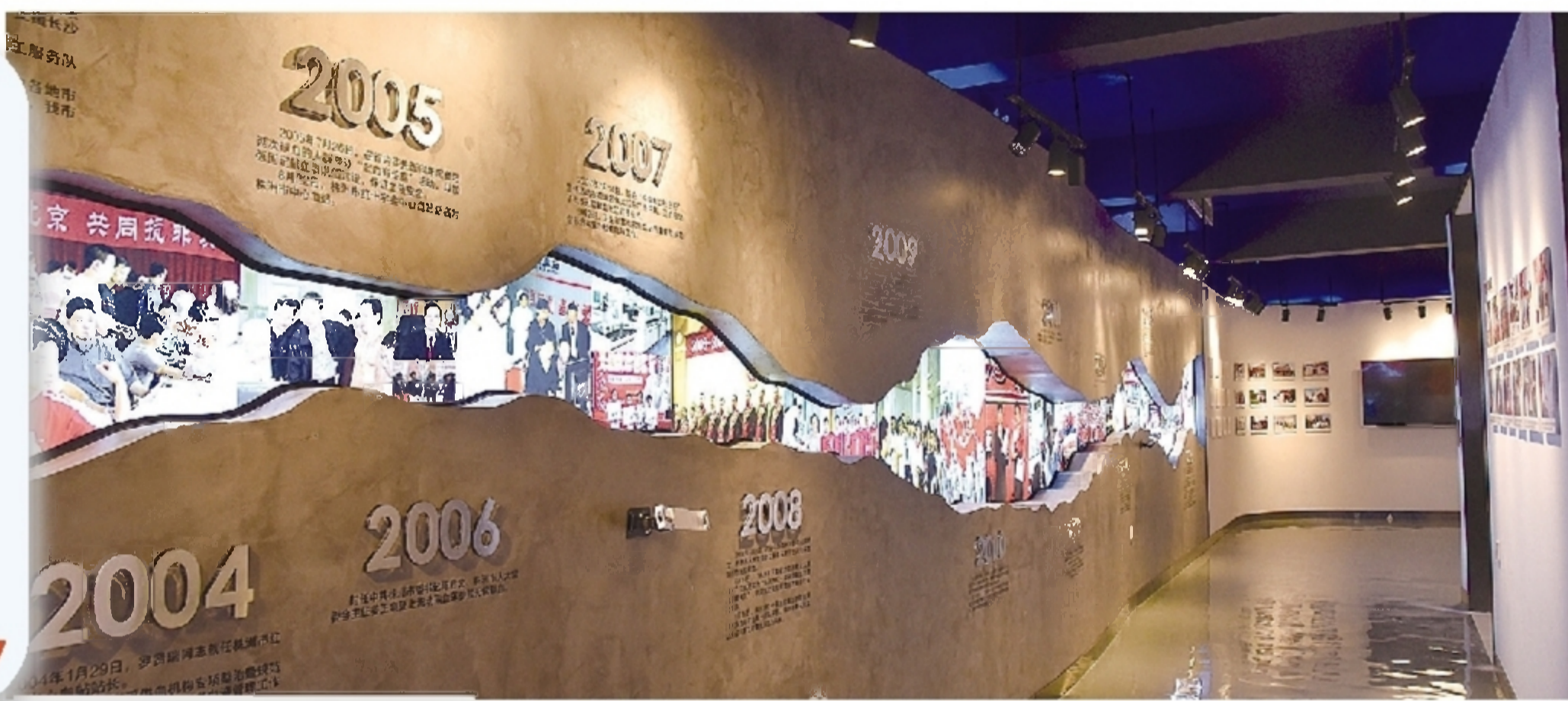
无偿献血体验式情境科普馆——无偿献血发展区