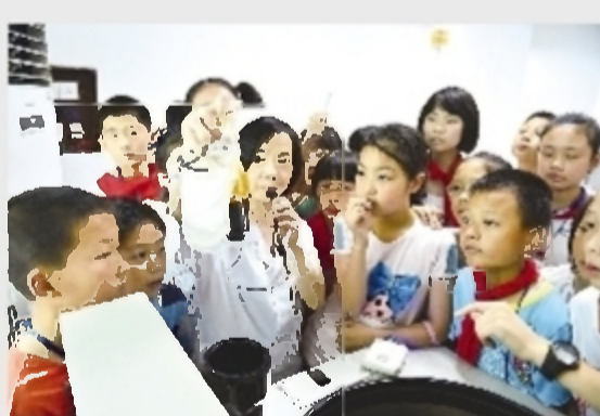
校园小记者体验采血的神奇旅程