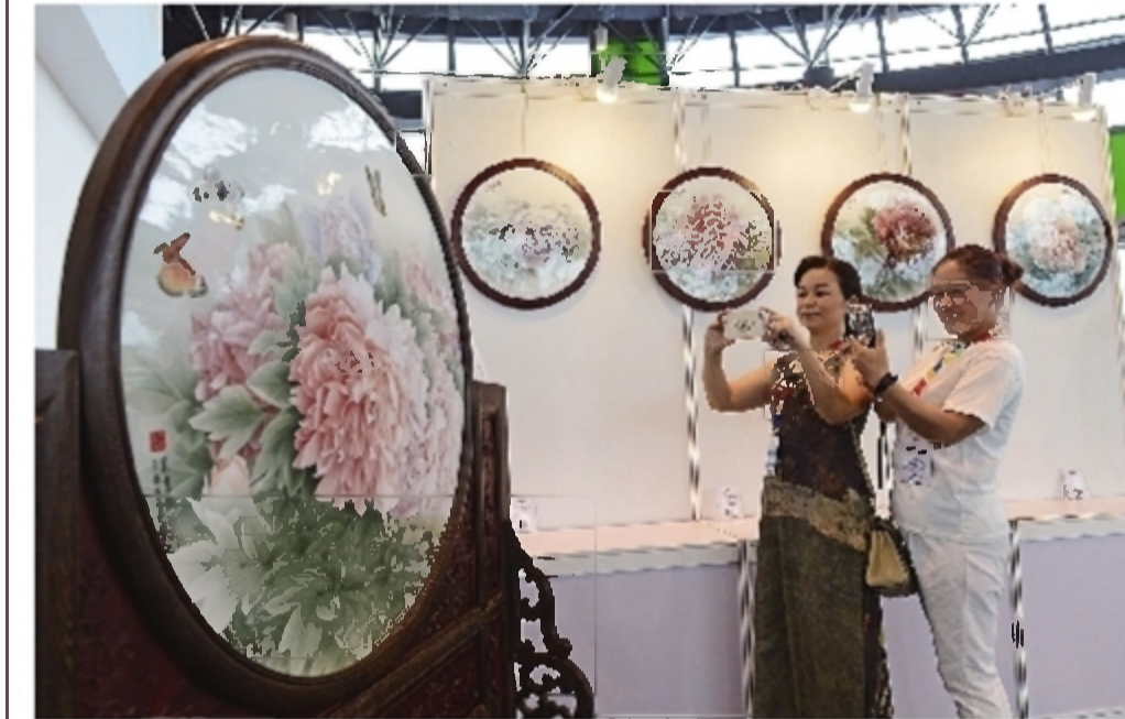
陶瓷大师艺术作品展示。 中青年陶瓷名家中国书画展。

□ 株洲日报全媒体记者 张洁 通讯员 彭明凯 贺翔 株洲日报讯 9月27日,中国硅酸盐学会陶瓷分会2017年学术年会在醴陵拉开帷幕。来自全国的200余位陶瓷行业专家学者齐聚醴陵,围绕陶瓷产业升级、产品创新、品牌建设等话题,交流陶瓷最新科研成果,共谋陶瓷产业创新发展。