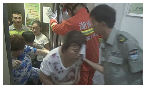
▲电梯故障导致多人被困,消防员和物业保安正在救援

本报讯(记者 刘玺)前日上午9时许,芦淞区科佳电脑城,一台电梯突发故障,导致10多名市民被困电梯内,其中一名女子因轻微缺氧出现头晕症状,幸被消防员及时救出。