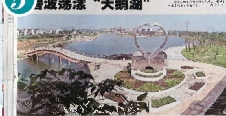
碧波荡漾，天鹅湖公园。