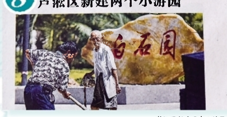
芦淞区新建两个小游园。