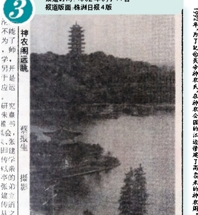
1992年，为了纪念炎帝神农氏在神农公园的江边修建了高台架的神农阁。