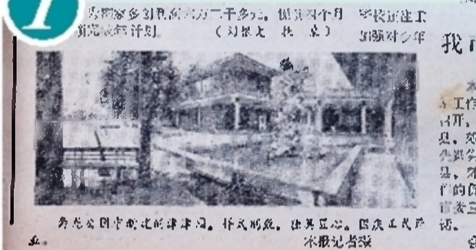
1981年10月，株洲公园更名为神农公园(今神农公园)后，国庆节期间对外开放。