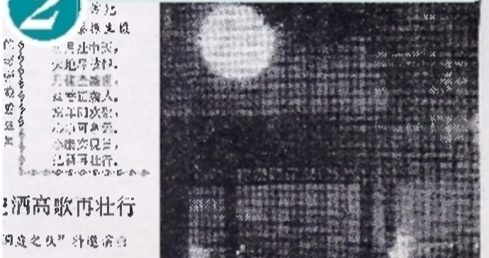
1987年10月7日，团月中秋，株洲日报摄影记者拍摄了神农公园(今神农公园)湖边夜景。