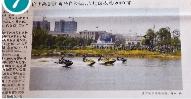
2016年5月16日，万丰湖公园正式开园。