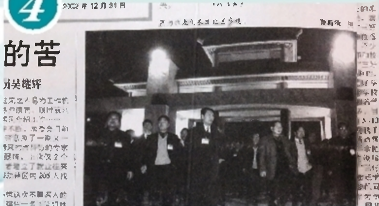
出席人大会议的代表们，参观文化园二期治理建设工程。