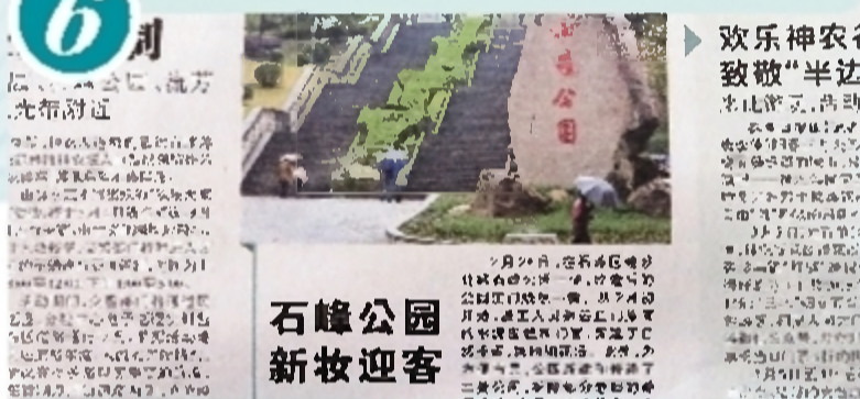
石峰公园新妆迎客。