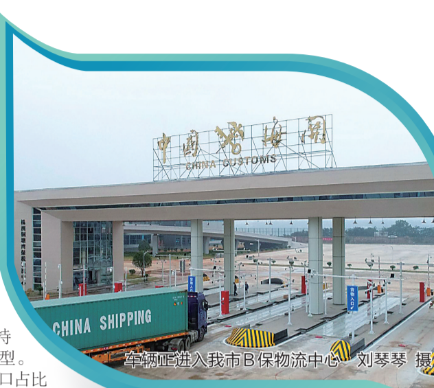
车辆正进入我市B保物流中心

贯彻落实习近平总书记“一带一路”倡议和省十一次党代会提出的“创新引领、开放崛起”战略,最大限度激发全市经济社会发展动力和活力,目前,我市正在酝酿出台《中共株洲市委关于贯彻落实<中共湖南省委关于大力实施创新引领开放崛起战略的若干意见>的实施意见》和《株洲市加快建成“一带一部”开放发展先行区实施方案(2017-2020年)》等一系列政策文件,力推开放发展。