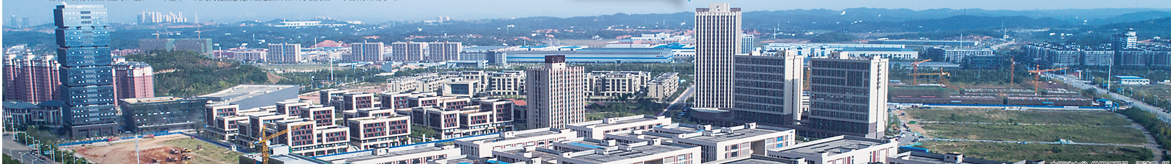
中国动力谷,世界正瞩目

开放发展的政策环境也在不断推进,去年,我市在全省率先推行“一门式”政务服务,让企业和办事群众“进一个门,在一个窗,办所有事”。