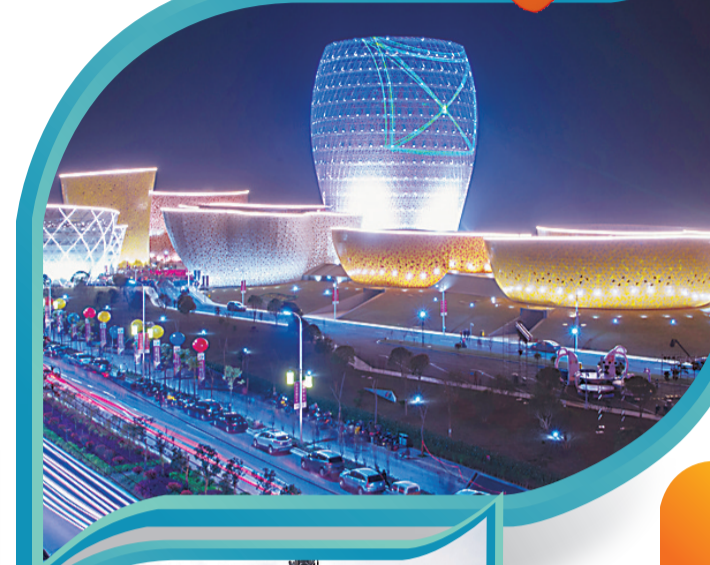
夜色中的醴陵世界陶瓷艺术城