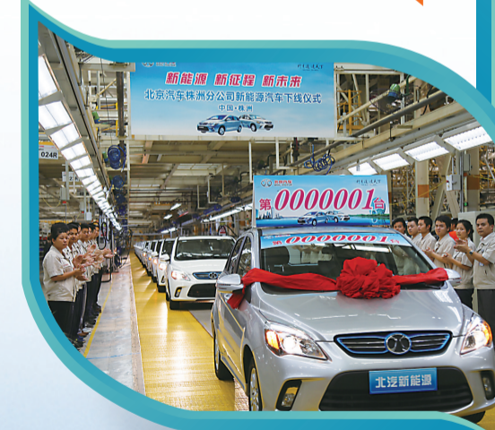
北汽株洲分公司新能源汽车下线