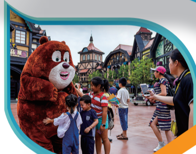
株洲方特欢乐世界