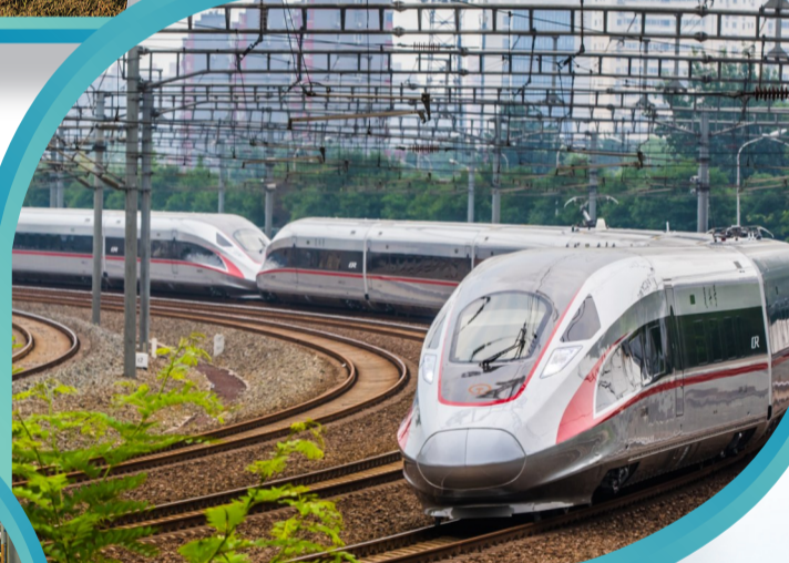
飞驰的“复兴号”有满满的株洲元素