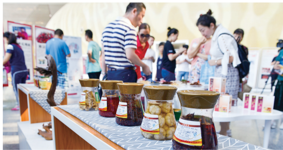
▲现场“非遗”产品展示

本报讯(记者 杨如 实习生 曾悦 通讯员 谢昱婷)昨天上午,我市推动非遗产品进市场活动启动仪式在神农大剧院举行。此活动目的是为促进非遗的生产性保护,使非遗的保护和传承融入生活,培育形成经济发展的新动力。