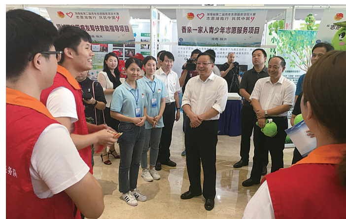
▲市委副书记雷绍业与志愿者交流项目

本报讯(记者 戴凛 通讯员 刘汇文)9月13日、14日,“志愿湖南行 共筑中国梦”湖南省第二届青年志愿服务项目大赛总决赛暨颁奖典礼在我市顺利落幕。全省共有100个志愿项目参加现场路演和项目答辩。最终,有30个项目获金奖,70个项目获得银奖。