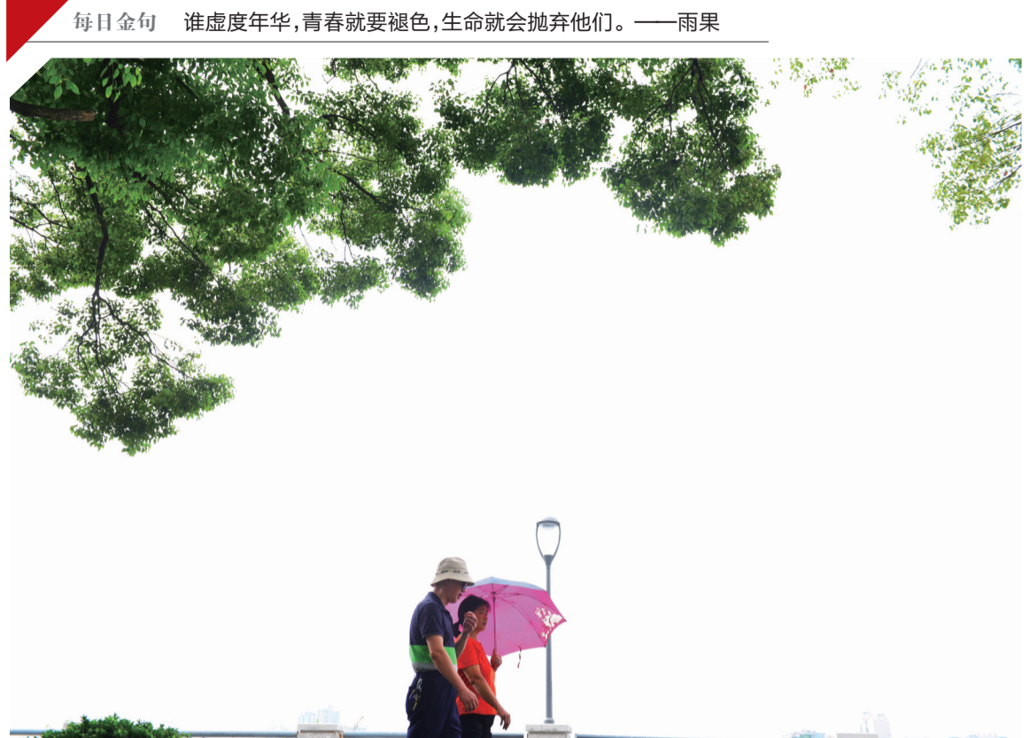
▲9月13日,河东沿江路,市民迎着秋风在江边漫步

●荷塘区 停气范围:金山路长江硬质合金设备有限公司 停气时间:9月19日14:00-17:00 停气原因:管道焊接 (株洲新奥燃气)