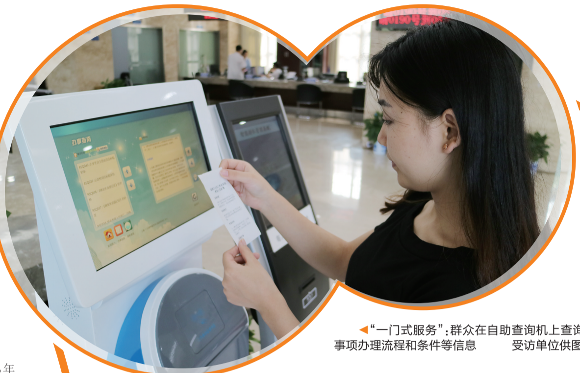
“一门式服务”，群众在自助查询机上查询事项办理流程 and 条件等信息