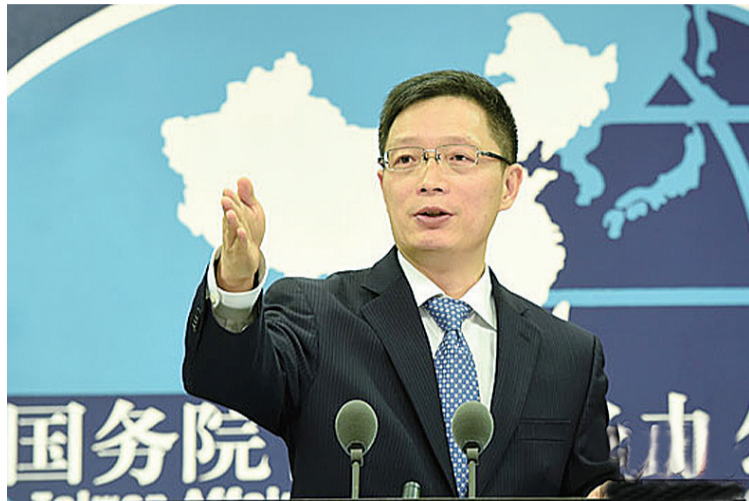
▲国台办发言人安峰山