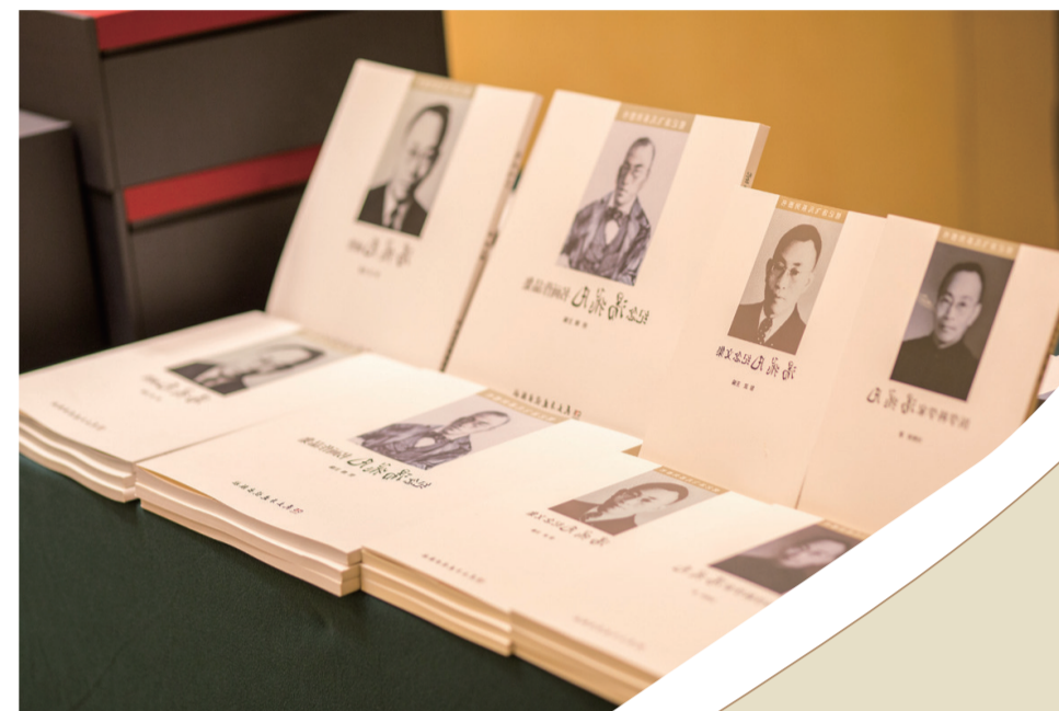
▲“铭记汤飞凡”系列丛书