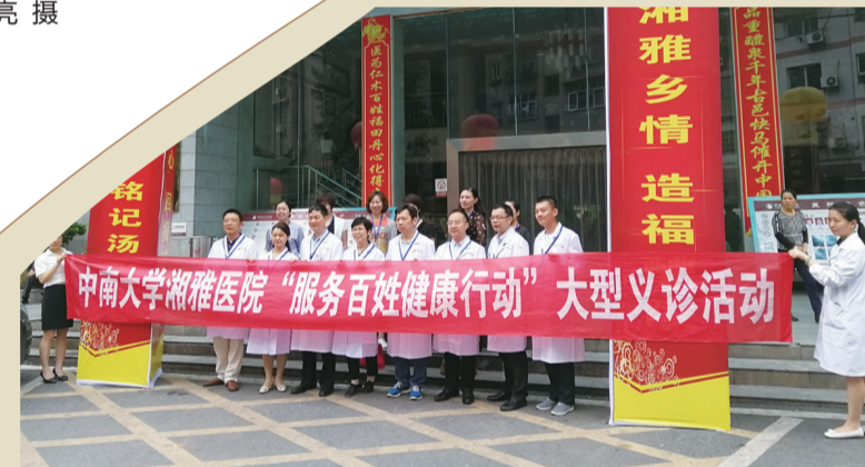
▲19位湘雅专家来到醴陵中医院义诊