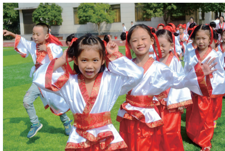
身穿汉服的萌娃们

9月8日上午,株洲市外国语学校石峰学校的操场上,一个个穿着汉服的一年级新生们,在老师的带领下排着整齐的队伍走向舞台中央。原来,这是该校正在举行2017年下学期“开笔启蒙,慧悦人生”小学开学典礼。 “开笔礼”是中国传统中对少儿