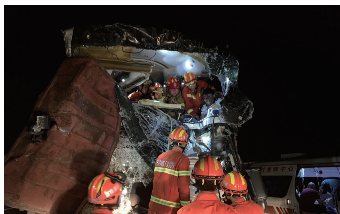
▲消防救援现场

本报讯(记者 刘玺 通讯员 刘杰)前日0时20分许,沪昆高速1025公里处发生一起三车连环追尾事故,一辆双层客车(长途卧铺)上的5名司乘人员被困,幸被消防部门及时救出。