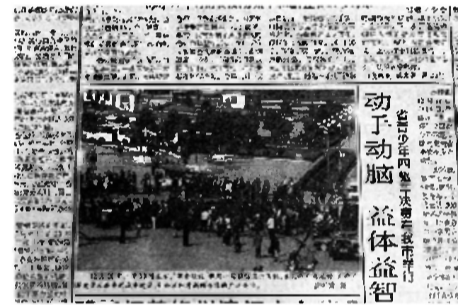
报道时间:1999年12月22日 报道版面:株洲日报A1版 当年12月20日,湖南经视租用直升机,在神农城广场对我市城市建设进行采访。