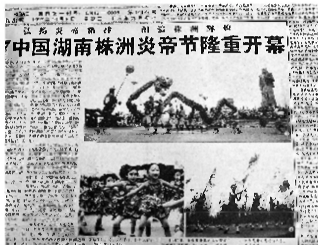
报道时间:1997年10月8日 报道版面:株洲日报A1版 1997年10月7日,97中国湖南株洲炎帝节隆重开幕。这也是神农城广场建成后,迎来的首次重大活动。