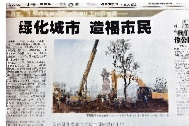
报道时间:2010年4月14日 报道版面:株洲日报A1版 神农城建设中,绿化先行,绿化城市,造福市民。