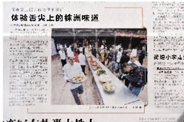
报道时间:2015年11月9日 报道版面:株洲日报A1版 我市第二届美食文化节在神农城举行,体验舌尖上的株洲味道。