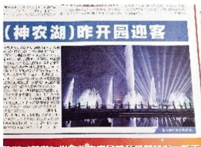
报道时间:2011年10月19日 报道版面:株洲日报A1版 2011年10月18日,神农城(神农湖)正式开门迎客。