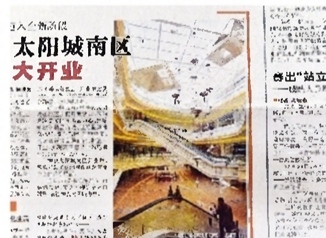
报道时间:2012年12月25日 报道版面:株洲日报A1版 神农太阳城南区盛大开业。