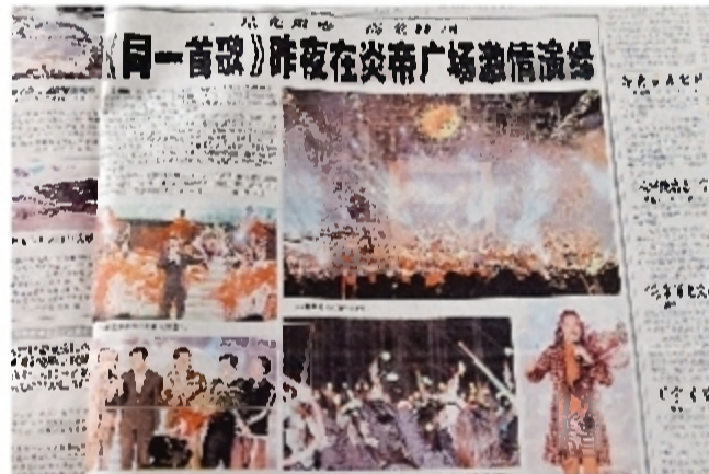
报道时间:2004年11月28日 报道版面:株洲日报A1版 “《同一首歌》走进株洲”大型演唱会,11月27日晚在神农城广场举行。