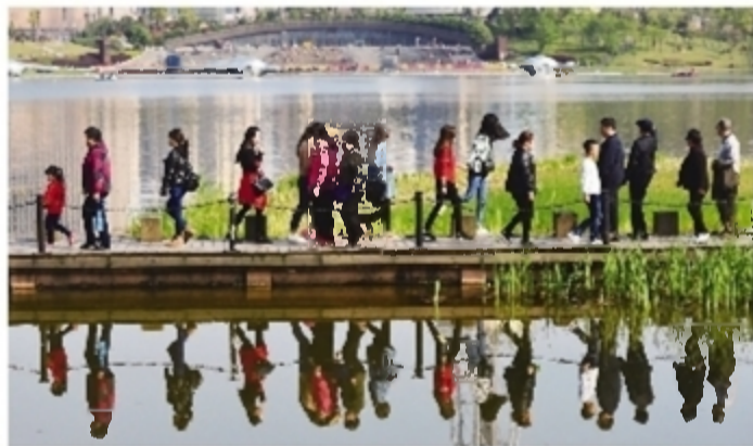
神农城中 在水一方

株洲是中华民族炎帝神农氏的发源地之一,中华民族始祖炎帝神农氏的陵墓就坐落在株洲境内的炎陵县,成为海内外炎黄子孙寻根谒祖、凭吊先尊的圣地。1995年,为弘扬炎帝精神,扩大株洲影响,一座多功能标志性工程——炎帝广场,开工建设,至1997年10月正式建成。 2009年12月,神农城动工兴建,真以神农文化为主题,在原炎帝广场和天台公园的基础上进行提质改造,建设了神农太阳城、神农湖等九大标志性建筑和景观。神农城广场占地面积163亩,建有高19.97米高的炎帝神农像,以其为中心,布置了大型旱喷设施,形成美丽壮观的水幕景观。神农湖占地330亩,设有欢乐谷、水华田等众多景点,其中在湖面上,利用声光电等高科技技术,向市民展示水秀、火秀、灯光秀、舞台秀、音乐秀、船秀组合等表演。神农大剧院自2016年10月建成后,已承接海内外文艺团体演出达130多场。神农城,俨然成为城市居民交流互动的核心平台,带给城市的欢笑和希望,化作株洲日报上那一个个精彩的光影瞬间,成为这座城市的集体记忆之一。