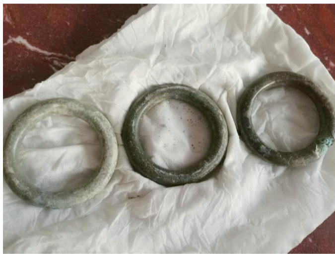
▲警方追缴的文物