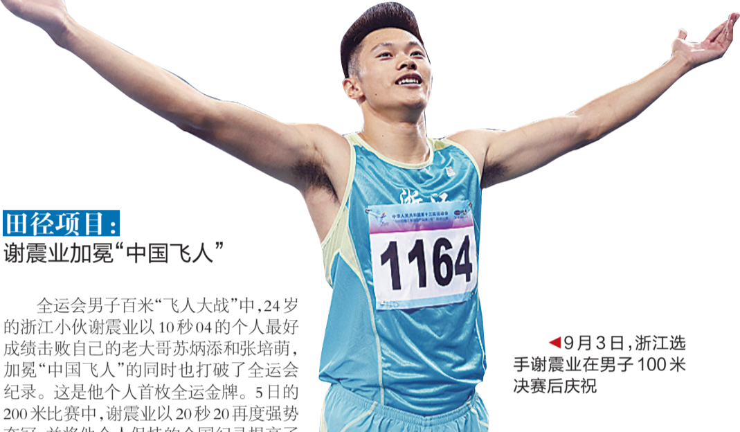
田径项目: 谢震业加冕“中国飞人”

经过12天的角逐,第十三届全运会于8日晚闭幕,在本届全运会上,众多项目都比出高水平。从竞赛成绩来看,在射击、举重、自行车、田径、游泳5个项目上,有3人1队4次超4项世界纪录,2人3次超3项亚洲纪录,9人1队11次创11项全国纪录,1人2队3次创3项全国少年纪录。此外,在游泳、乒乓球等十余个项目上,涌现了近二十名希望之星,值得期待和重点关注。