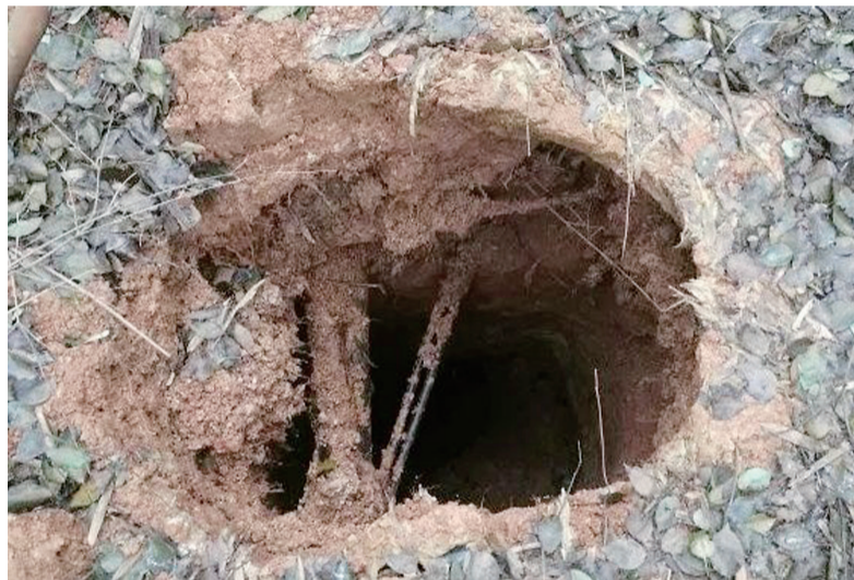
▲盗墓现场留下的盗洞