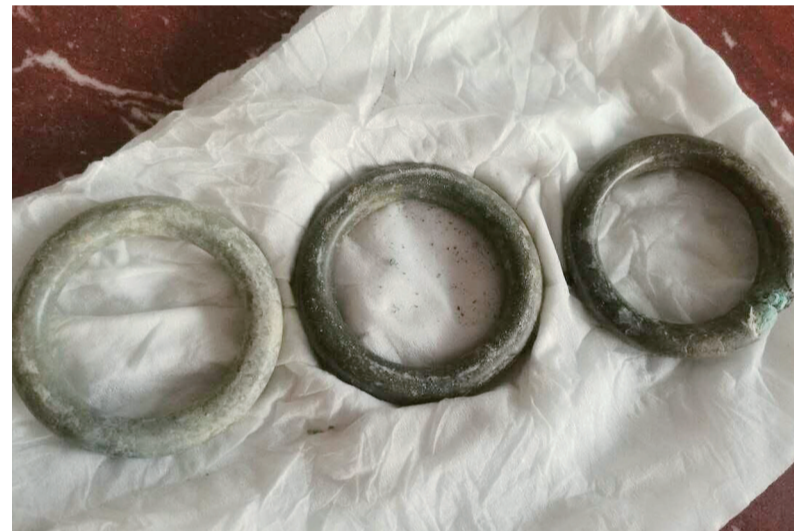
▲警方追缴的部分文物