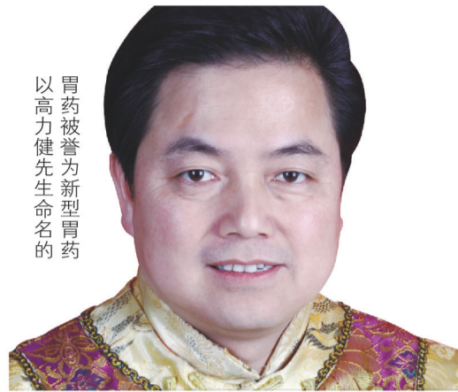
以高力健被誉为新型胃药的