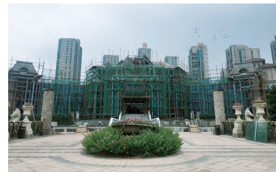
▲奥园·一号湖畔营销中心正在全面升级改造

现奥园·一号湖畔营销中心正在全面升级改造,以法式庄园风格为基调,高端大气为要求,九月底将以全新形象亮相神农湖畔。敬请市民期待!