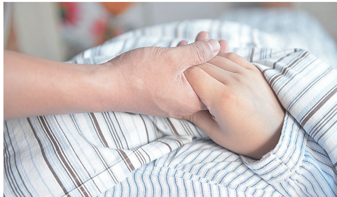
▲2014年5月,某医院妇产科,宋先生握着即将进产房分娩的妻子的手(资料图)

有媒体报道,近日,陕西榆林市第一医院绥德院区一名产妇在分娩过程中,两次下跪要求剖宫产被拒绝,最终这名产妇从医院坠楼身亡。该起惨剧引发我市不少市民关注和讨论,甚至不少待产孕妇为此产生了担忧:“生孩子,难道就不能产妇产自己决定?”