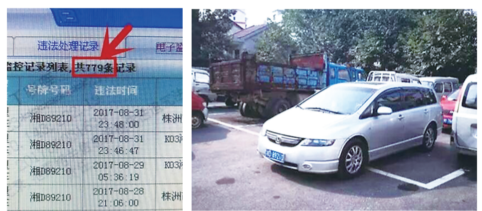
▲攸县交警大队查获的违法记录多达779条的“违法王”

本报讯(记者 肖蓉 通讯员 彭晚华)9月3日,攸县交警大队查获了牌照为湘D89210的车子。这辆车自10年前第一次交通违法以来,就从未处理过违法记录。目前,该车已累计有779条交通违法记录,成为我市目前已查获的交通违法条数最多的车。