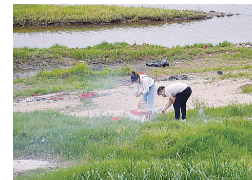
▲昨日,市民在湘江边烧纸钱祭祖

本报讯(见习记者 唐飞虎)农历七月十五是中国传统的重要祭祀节日——中元节,民间也称“七月半”。每年该节前后,一些市民沿着街道、河边或在小区公园周围焚香烛、烧纸钱,而这种祭奠方式不仅会造成环境污染,同时还存在火灾隐患。记者从市城管局了解到,中元节前后他们都会增加人手上街巡查,对不文明祭扫行为进行劝导,同时也加大了环卫保洁力度。