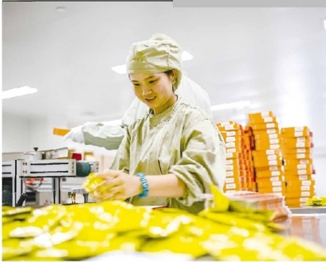
上半年,千金集团销售规模再创新高。