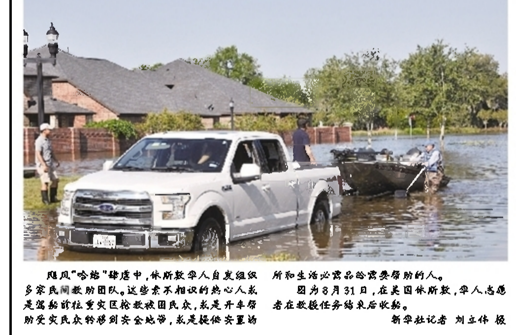
飓风“哈维”肆虐中,林斯敦华人自助组织多蒙民间救援队。这些素不相识的爱心人士是驾驶新拉重灾民救援队民船,载着开车的受灾民众转移到安全地带,或是提供安置场所和生活必需品的需要帮助的人。 因为8月31日,在美国林斯敦,华人志愿者在救援任务结束后合影。