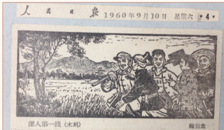
▲梅剑龙1960年9月10日发表在《人民日报》上的木刻作品