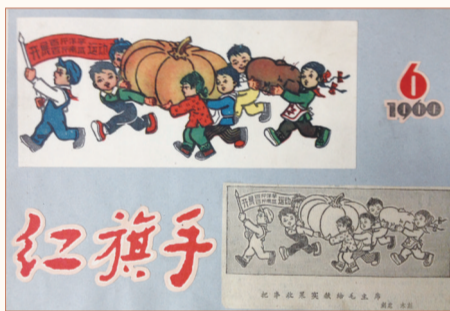
▲1960年6月的丰收木刻作品