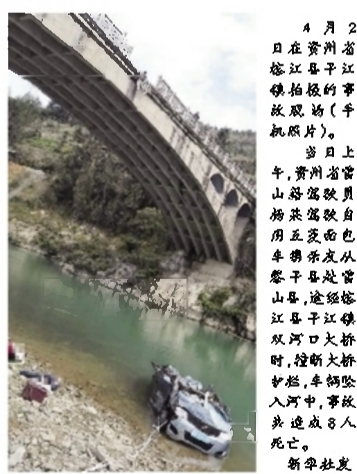
4月2日，贵州省榕江县江铁大桥的事故现场(手机照片)。当日上午，贵州省黔东南苗族侗族自治州榕江县江铁大桥发生道路交通事故，致8人死亡。