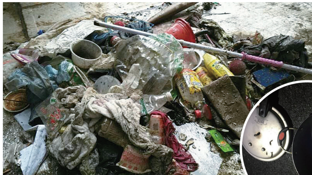
▲小区高空抛物频发,业主们清理的各式高空抛物物品 ▲有人往楼下扔高压锅盖和炒锅

事发佳兆业·金域天下小区,所幸未造成人员伤亡 律师:高空抛物未造成损害,公安机关也可进行治安处罚