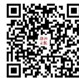
▲扫一扫,看智能停车库显身手