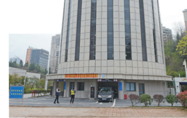
▶圆形高层智能停车库外貌

本报讯(记者 邓石华 通讯员 尹郁)昨日上午,天元区行政中心全自动立体停车场项目正式投入使用。该项目共设机械停车位100个,平均70秒存取一台车,可有效缓解天元区政府停车难问题。