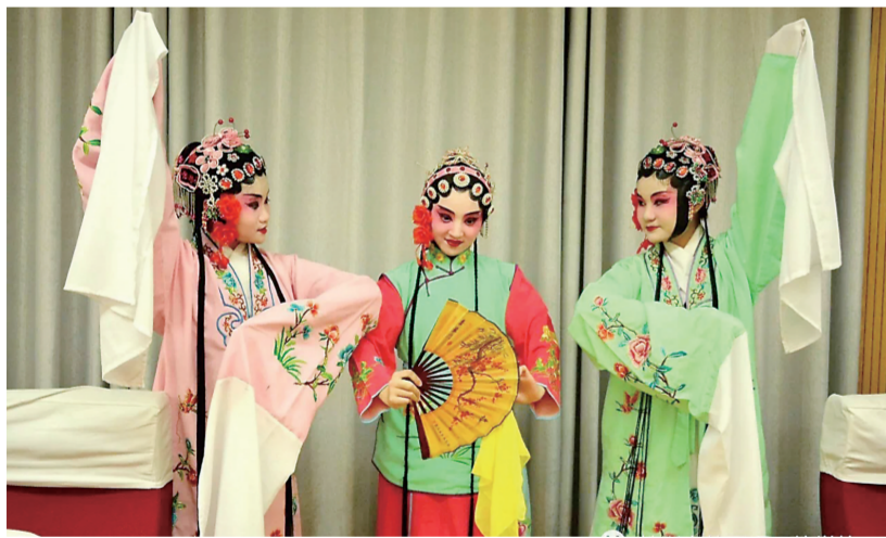
▲“小戏骨”们在台下候场时抓紧时间练习

上周,株洲市外国语石峰学校在株洲戏曲进校园启动仪式上,捧回了湖南省戏曲传承教育基地的奖牌,如获至宝。