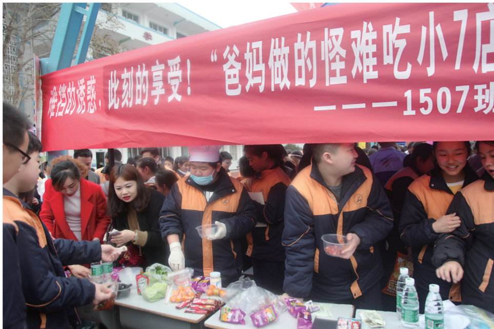
▲学生家长也积极参与了本次爱心集市活动

学校负责人介绍,这样的爱心义卖已经成为了学校传承多年的经典活动,已经上升为学校的一门生动的德育课程。这场活动正是我市素质教育、德育教育的一个缩影,透过这样的活动,培养了学生的爱心,也锻炼了同学们的综合能力,提升了他们的动手能力、口头表达能力和实践能力。除了爱心义卖外,我市中小学在实现“立德树人”的目标时,还通过与传统文化结合以及开展阳光体育运动等方面做出了不少尝试。(记者 宋芋璇)