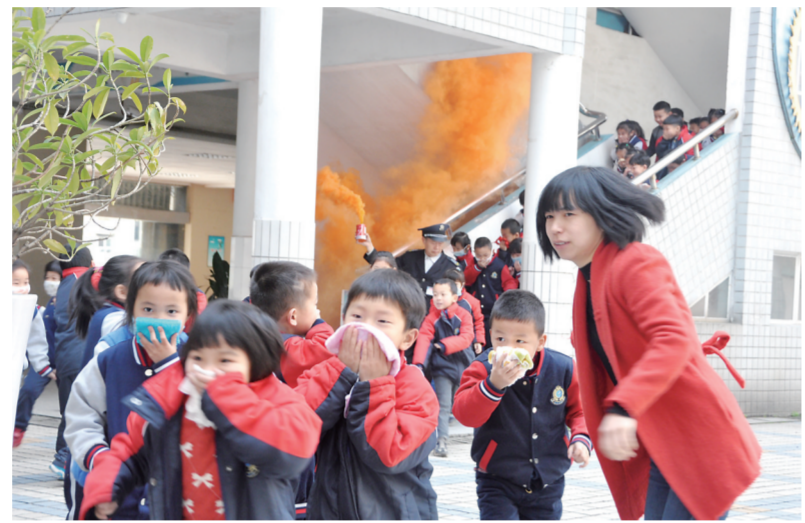
▲天元区一学校在举行疏散演练