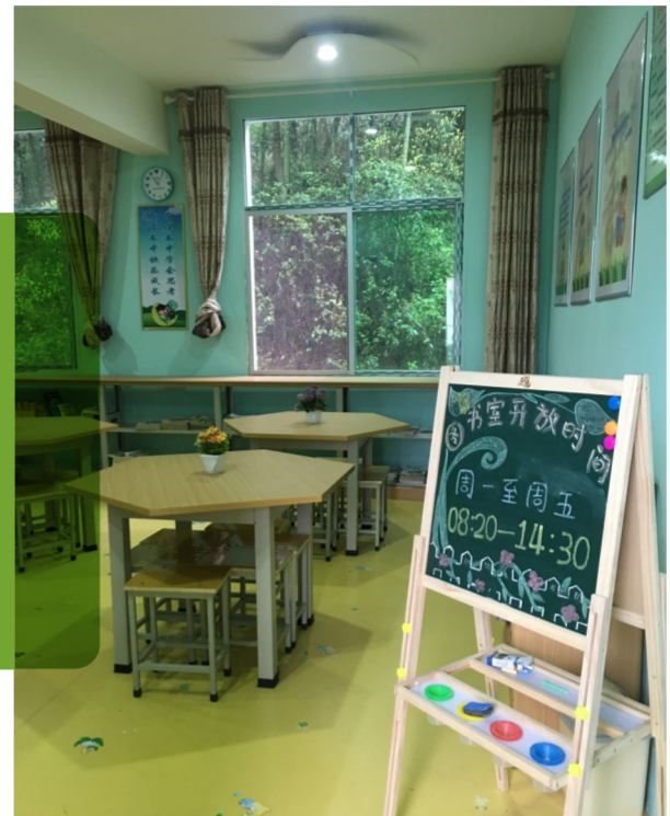
▲全市218所村小,都会增设一处“知了书屋”,满足孩子们课外阅读需求

本报讯(记者 何春林 通讯员 王亚)记者昨从市教育局获悉,我市出台了《株洲市农村小规模学校提质工程实施方案》,市政府已将农村小规模学校提质工程(简称“村小提质工程”列入2017年“民生100”项目。今年起,我市会继续通过村小新(改扩建)、师资补给、增设图书屋等途径,帮助村小“变身”。