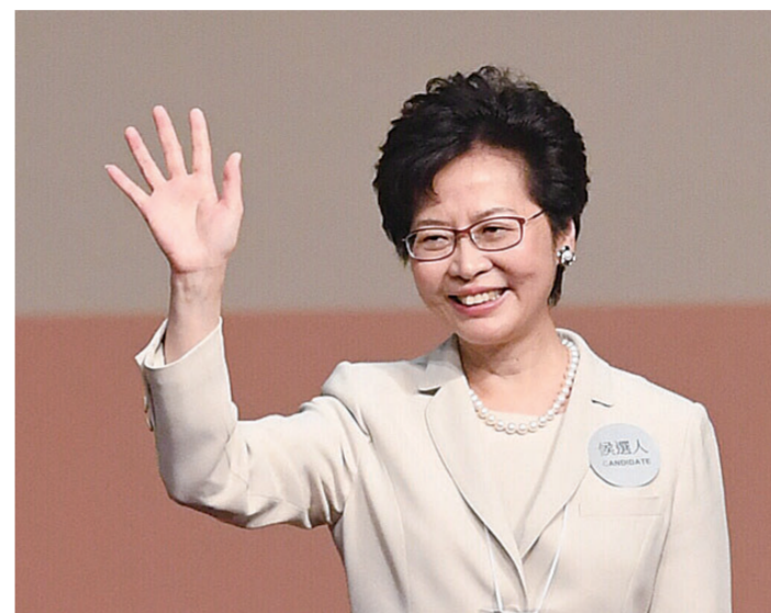
▲林郑月娥当选香港特区第五任行政长官人选后会见媒体

林郑月娥26日在香港特别行政区第五任行政长官选举中获得777张有效选票,当选为香港特区第五任行政长官人选。