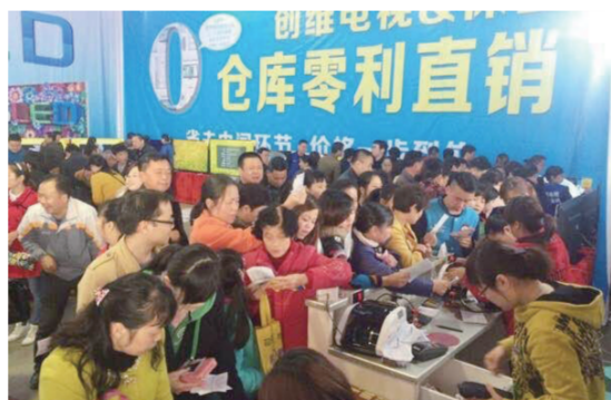
▲2012年株百家电仓库直销

作为株百年度促销盛宴,下个月8号,2017年株百第二屆全業態倉庫直銷就要拉开帷幕,一场购物盛宴即将引爆全城,你的钱包准备好了吗?自2012年以来,株百家电仓库直销已经成功举办了5届,相信不少市民对于株百家电仓库直销,都有着深刻的记忆。今天,就让小编带大家回顾一下,那些年,我们一起经历过的株百家电仓库直销吧!