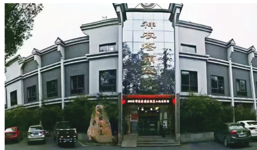
▲神农康复医院大门

不定期对神农康复医院进行业务指导等技术帮扶,将大大提高株洲神农康复医院的医疗业务水平和服务水平。