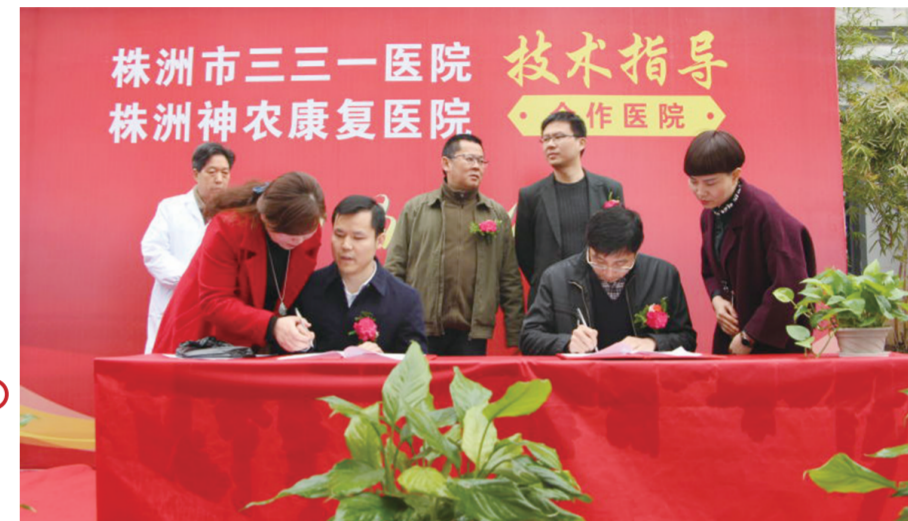
▲株洲市三三一医院与神农康复医院签订协议书

在慢性疼痛、颈、肩、腰、腿疼痛方面有很深的造诣。擅长小针刀、臭氧、神经阻滞骶管冲击疗法、射频微创消融治疗颈肩腰腿疼痛、骨关节炎。多次参加全国各类骨病学术会议,发表论文多篇。