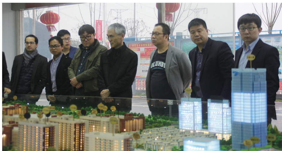
▲专家组一行来到天易科技城考察

本报讯(记者 伍靖雯)本月25日,有家专门生产研发石墨烯产品的公司,带着多家中外企业负责人、相关专家来到株洲考察,洽谈石墨烯项目落户天易科技城的事。石墨烯产品有何稀奇之处?项目落户株洲将产生怎样的“化学反应”?记者对此进行了了解。